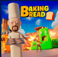
BAKING BREAD Tipo: Tycoon Código: 1632-2741-5129