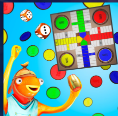
PARCHIS - PARCHISI Tipo: Juego de mesa Código: 7211-0454-5755