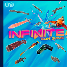
INFINITE GUN GAME 2.0 Tipo: Gun Game Código: 3289-1022-6941